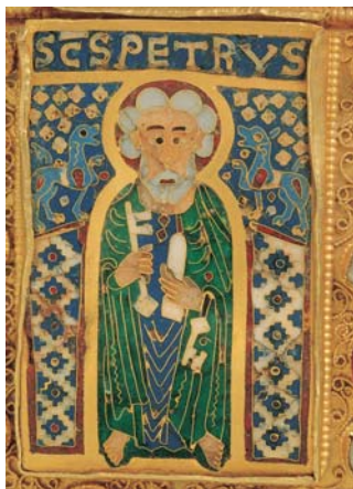
Péter apostol zománcképe a felső Pantokrátor jobbja felől