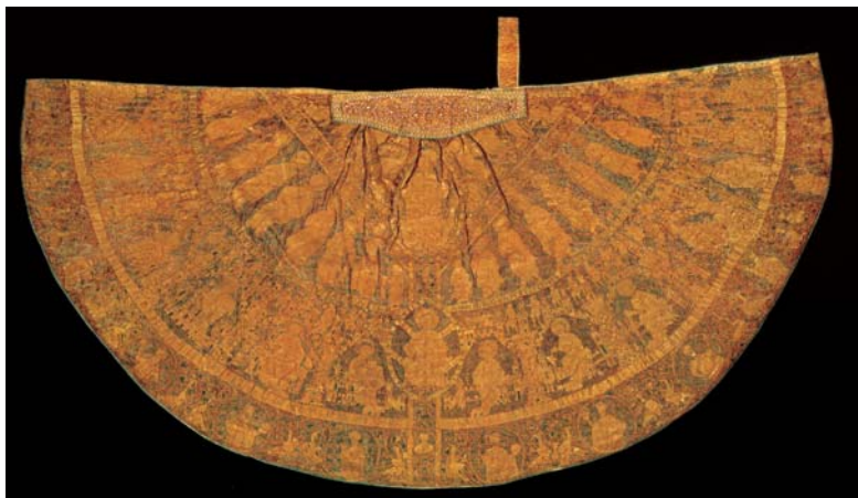
A koronázási palást kiterített képe: legfőlüli középütt a Győzedelmes Krisztus, két oldalán a felső sorban álló alakok az Ószövetség kis és nagy prófétái, alattuk tizenkét ülő apostol, a legalsó sorban tizenkét férfi mártírszent mellképe

Ezzel a „jelvényel” – első közelítésre úgy tűnhet – kevesebb gondunk lesz, mint bármelyik másikkal. Ráhímezve ugyanis a következő felirat olvasható (magyarra fordítva és némileg tömörítve): „ez a miseruhát Krisztus megtestesülésének 1031. esztendejében (...) készítette és adta István király és Gizella királyné a fehérvári Szűz Mária egyháznak”. A készülés dátuma tehát biztosra vehető, mint ahogy az is, hogy a magyar királyok koronázási palástja eredetileg miseruha volt. A készíttető és adományozó királyi pár maga is megjelenik a paláston, a legalsó sorban, névfeliratokkal. A gond mégis