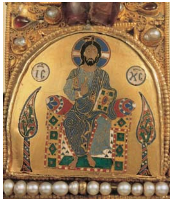
Az alsó Pantokrátor-kép a Korona abronc- sán

– az egyik a Napra, a másik a Holdra és a csillagokra emlékeztető jelcsoport – egyértelműen elárulja, hogy itt a világosság és a sötétség szétválasztásáról van szó, ez pedig nem a Fiú feladata, hanem az Atyáé. Képünk tehát nem a fiúság megjelenítője, hanem az atyai tulajdonságoké – méghozzá a teremtés első mozzanatában. Feltételezhetően azért kellett kétszer megjeleníteni a „pantokrátort”, a keresztpántok tetején is, az abroncon is, mert ezt a felső zománcképet emberi szem elvileg sohasem láthatja. (Beavató koronával csak koronázáskor lehetne találkozni, de a király fölé akkor sem kerülhetünk!) Ez a kép egyenesen visszacsatolódik az Atyához.