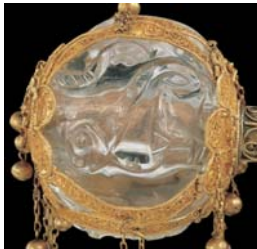
A jogarfej, a kristálygömbbel és az arra metszett egyik oroszlánnal

Ha szakralitás szempontjából nem is állja az összehasonlítást, művelődéstörténeti szempontból viszont mindjárt a Szent Korona után következik a jelvényegyüttesben a jogar. Három mozzanatot szokás kiemelni a rajta alkalmazott motívumkészletből. A nyelén, illetve a jogarfejet alul-felül körülölelő pántokon és „szirmokon” végigfutó filigrán díszítést – hasonló technikával a Korona keresztpántjain is találkozunk –, a jogar-fej