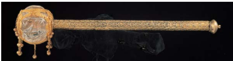
A magyar koronázási jogar