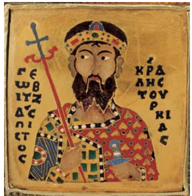
Geóbitzász cserélt zománcképe az arbronsz hátsó részén, a király bal keze felől