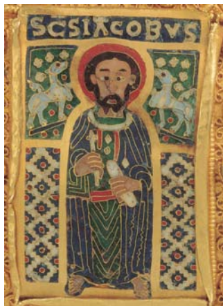
Jakab apostol zománcképe a Korona hátoldalán, a keresztpántok felső emeletén

háttal elhelyezkedő alakot pedig a nyaka vonaláig eltakarja az a kép, amelyik a hátsó, egyetlen kiemelkedő elemből álló pártázatnak a foglalatára van szegecselve. Ennek az apostolnak tehát csak a feje látszik. Mármost tudni illik, hogy az emberi testnek ez a része a képírás-típusú művészetben, amely képjelekkel fogalmaz, nem pedig látványból kiin-