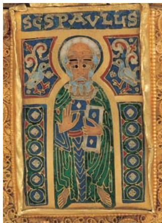
Pál apostol zománcképe a felső Pantokrátor bal keze felől