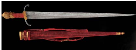
Az eredeti pótlására koronázási jelvényeink közé iktatott XVI. századi velencei kard, hüvelyével

alapítójának, Károly Róbertnek az utasítására készült, egy korábbi, színarany példány helyébe.