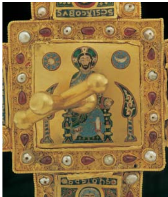
A felső Pantokrátor-kép a Korona kereszt- pánt- rendszeré- nek csú- csán