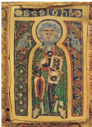
János apostol és evangélista az egyetlen a Koronán megjelenített szentek közül, aki egyenesen szembe néz velünk