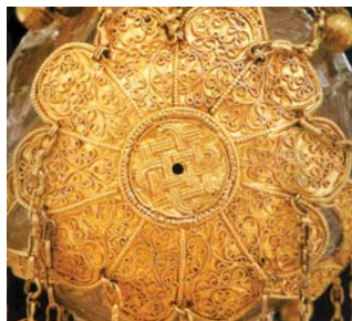
A jogarfej felülnézeti képe, a filigrán-díszes virágkehellyel, annak közepén a mágikus csomóval

tetején látható „mágikus csomót, és a fejbe foglalt, három oroszlánnal díszített hegyikristály gömböt. Ez utóbbit a szakkutatás eléggé egyöntetűen a Szent István korában Egyiptomban uralkodó Fatimida dinasztia köréből származtatja. Ennek a családnak az uralma alatt élte az Iszlám a maga korai történelmének legbékülékenyebb időszakát. Az Ihván-irányzat ekkor és itt, Egyiptomban lehetővé tette az „igazhitűeknek”, hogy közvetlen, olykor éppen baráti kapcsolatokat építsenek ki az európai – akkor még egységes – keresztény egyház jeles képviselőivel. Az oroszlánok viszont, mint a világi értelemben vett királyság jelképei, a legrégebb idők óta jelen vannak a jogar-szerepű fejedelmi buzogányokon. Az ókori Mezopotámiában Meszylimnek, Kis városállam királyának a hatalmi jelvényén tűnnek fel először, a Kr. e. IV – III. évezred fordulóján, hasonló szerepkörben. Megjegyzendő: a jelenkor tudományossága a hegyikristályt úgy is számontartja, mint az információátvitel ideális eszközét. Hogy ez a lehetőség jogarunk kristálygömbje esetében is fennáll, az vitathatatlan tény. A kérdés csak az, hogy ismerték-e, és ha igen, kihasználták-e elődeink ezt a lehetőséget. Amennyiben pedig tároltak benne a szakrális királyság jogrendjére vonatkozó információt, azt milyen