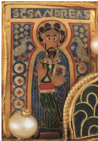
András apostol zománcképe testvére, Péter alatt helyezkedik el a kereszt- pánton