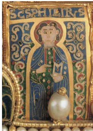
Fülöp apos- tol zomán- képe Andrással szemben, a keresztpán- tok alsó emeletén, a király bal keze felől

hanem Fülöp és Jakab ketten szállták meg a naptárban május 1-jét. És itt minden valószínűség szerint a májusi „zöld ág” képviselőjét látjuk Jacobusunk kezében.