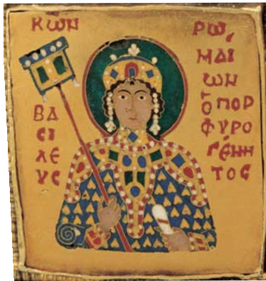
Kón(stantin) cserélt zománcképe az arbronsz hátsó részén, a király jobbra felől