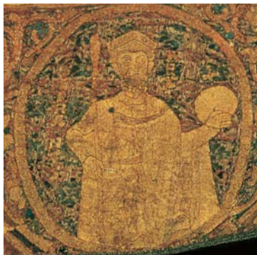
„Stephanus rex” (eredetileg Sebaldus) feliratú mellkép a palást alsó, vértanú szenteket megjelenítő sorából