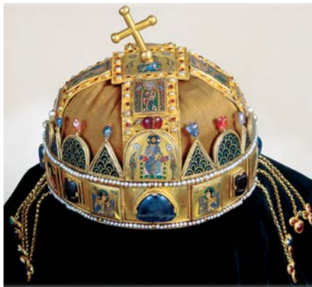
A magyar Szent Korona szembenézeti képe