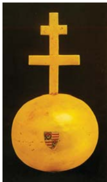
Az országalma az Anjou-címerrel

A kettős kereszttel ékesített, aranyozott ezüst gömb, oldalán a zománc díszű Anjou-címerrel, minden valószínűség szerint a dinasztia