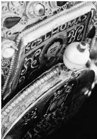
Tamás apostolt a nyakvonaláig eltakarja az előtte magasodó hátsó oromzati elem, amelyben eredetileg „a Szent Szűzanya képmása” volt, ma pedig Dukász Mihály bizánci császár utólag felszerelt zománcképe

a test és a lélek szintjén veszélyeztet bennünket, hanem felhat a szellem szintjére is. Ezért Bertalant a feje tetejéig el kellett takarni, mégpedig a legmagasabb szintű szellemiség képviselőjével, a Megváltóval.