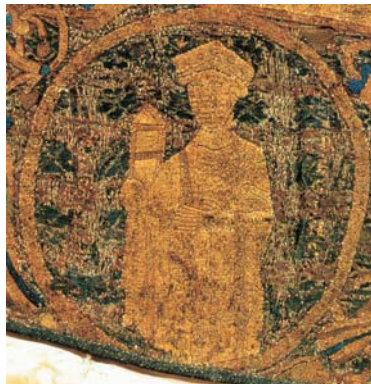
Az átalakított feliratú „Gisla regina”, mint szakállas férfi a palást alsó mellképsorában

éppen itt jelentkezik először. A „Stephanus” feliratból ugyanis hiányzik a T betű, a jelek egy része pedig meglehetősen durva és figyelmetlen áthímzésről árulkodik. Az eredeti szöveg vonásról-vonásra rekonstruálható, így biztonsággal állíthatjuk, hogy itt, a mártírszentek sorában nem István magyar királyt, hanem Szent Sebaldust örökítették meg. Ami a koronáját, a lándzsáját és a kezében tartott országalmát illeti, ezek valamennyi mártír fején, illetve kezében ott láthatók. Gizellával meg az a gond, hogy az ő eredeti felirata teljesen megsemmisült (valamikor valakik megsemmisítették), maga a „királyné” pedig – szakállas! Ugyanolyan dús körszakállat visel, mint akár a „férje”, akár a többi mártírszent. Hogy az átalakításokra mikor kerülhetett sor, arra nézve megoszlanak a vélemények. A legkorábbi dátum-javaslat a XI. század első felét, a legkésőbbi a XVII (!) század elejét jelöli meg a drasztikus beavatkozás időpontjául.